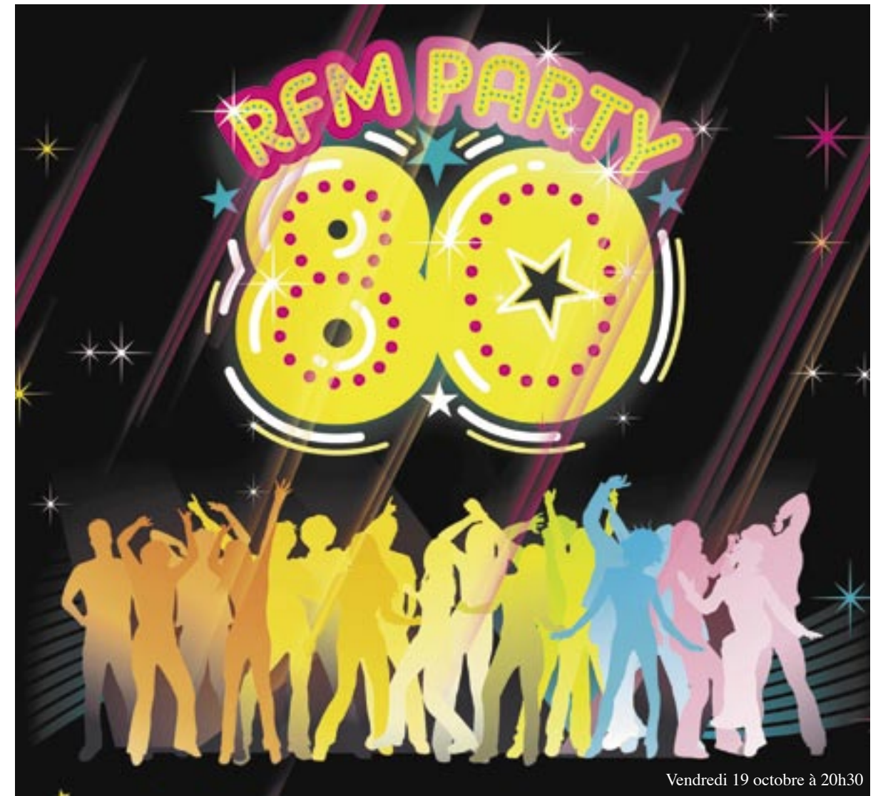
Vendredi 19 octobre à 20h30

Pour le spécialiste, ces années là sont celles du clip triomphant et, effectivement, il reste dans la tête du public beaucoup d'images associées aux artistes réunis pour cette « RFM PARTY » qui, après quatre Zéniths triomphaux en mars à Paris, va sillonner la France pour faire étape dans les plus grandes villes. Qui n'a pas un souvenir, une brève d'histoire liés à la panoplie de tubes qui vont être interprétés pour la circonstance... Une palette musicale qui balaie plutôt large entre Cookie Dingler, ovni surgit d'Alsace sur les rythmes d'un reggae qui va faire se déhancher l'été 84, et la voix puissante de Jimmy Somerville qui emporta encore plus haut le « You make me feel » de Sylvester au point d'en faire un de ces classiques que le temps n'est jamais parvenu à gommer du répertoire et des ondes. L'une des têtes d'affiche de cette tournée, Jimmy a inscrit à son répertoire deux autres mélodies aussi imparables, « Why » et « Don't leave me this way » que la présence de deux choristes à ses côtés rendent plus puissantes encore. Quinze artistes, trente chansons, de quoi revenir dans une décennie tout à la fois joyeuse et romantique durant deux heures et demie.