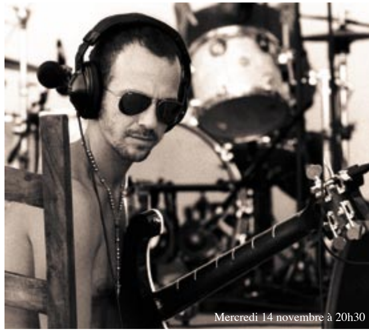
Mercredi 14 novembre à 20h30