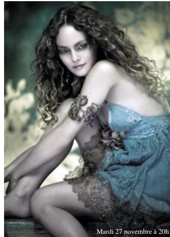
Mardi 27 novembre à 20h