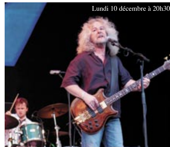
Lundi 10 décembre à 20h30

1996, « River of Dream », pressé sur leur ancien label, Polydor, aurait dû les positionner de nouveau parmi ceux qui font l'actualité tout en occupant une place